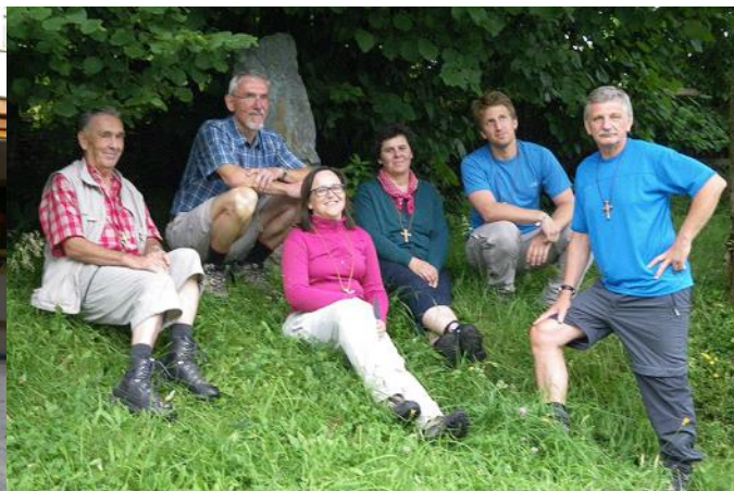
und Rast beim Gedenkstein in Mürzzuschlag

Am 21. Juli haben wir uns auf den Weg nach Mariazell gemacht. Viele von uns haben Anliegen der Pfarre, aber auch Persönliches mitgenommen.