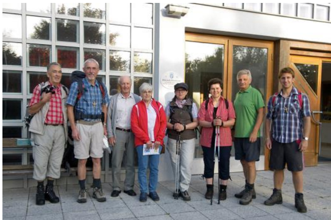
Aufbruch in Bad Tatzmannsdorf...

Fußwallfahrt nach Mariazell, 21.-24. Juli 2014