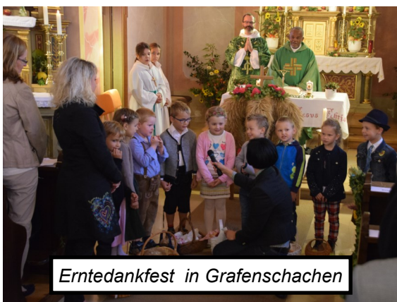
Erntedankfest in Grafenschachen