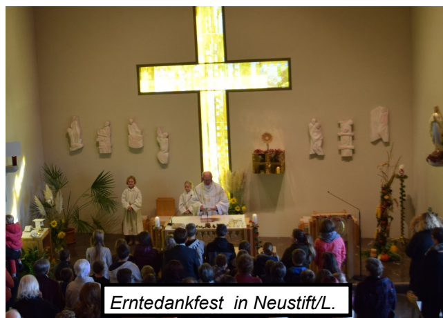
Erntedankfest in Neustift/L.