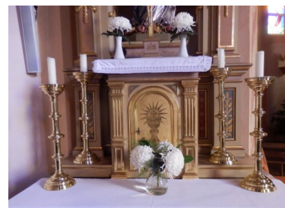
Die neu vergoldeten Kerzenhalter vom Marienaltar der Pfarrkirche