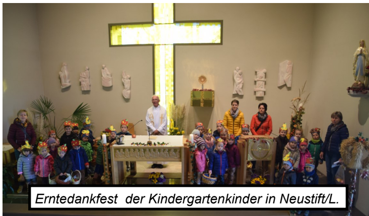
Erntedankfest der Kindergartenkinder in Neustift/L.